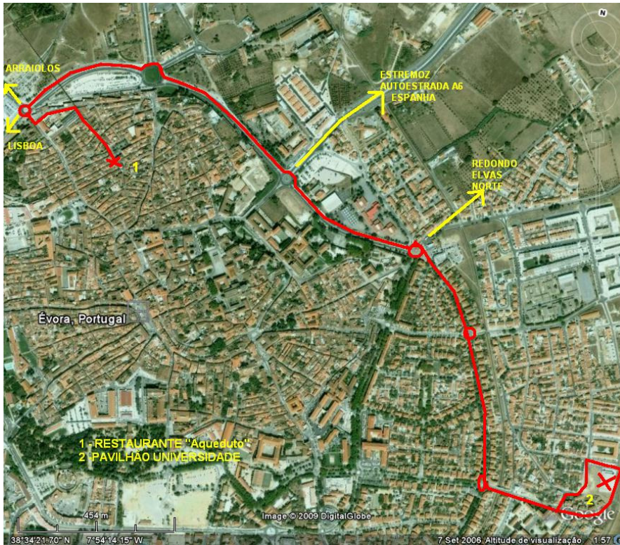
Mapa: Pavilhão da Universidade – Restaurante o Aqueduto